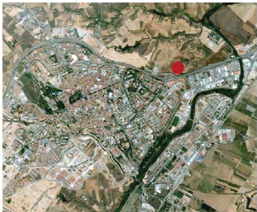
PLANO SITUACION/SITE PLAN

HEMOS AVANZADO EL INTERÉS EN ASUMIR EL CARÁCTER PROTAGONISTA DE ESTE EDIFICIO EN LA SILUETA URBANA EN LO QUE CONCIERNE A LA MEMORIA COLECTIVA SOBRE EL PAISAJE Y LA ESCENA URBANA.