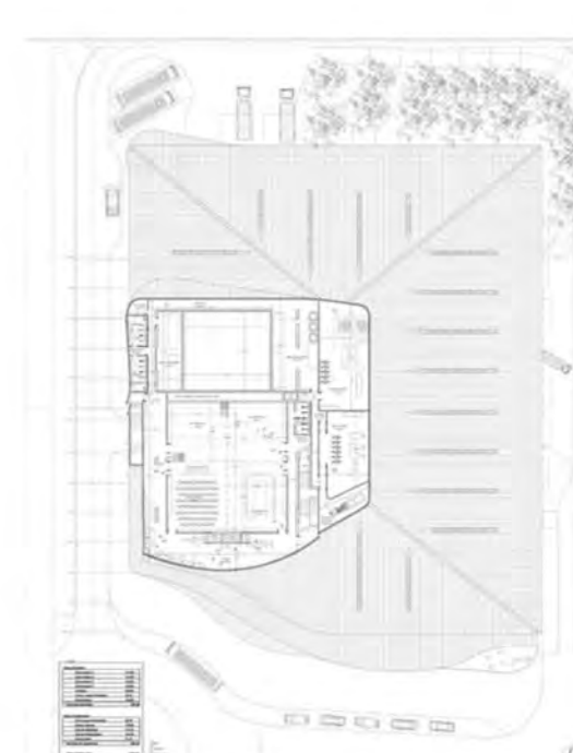
TERCERA PLANTA/ THIRD FLOOR PLAN