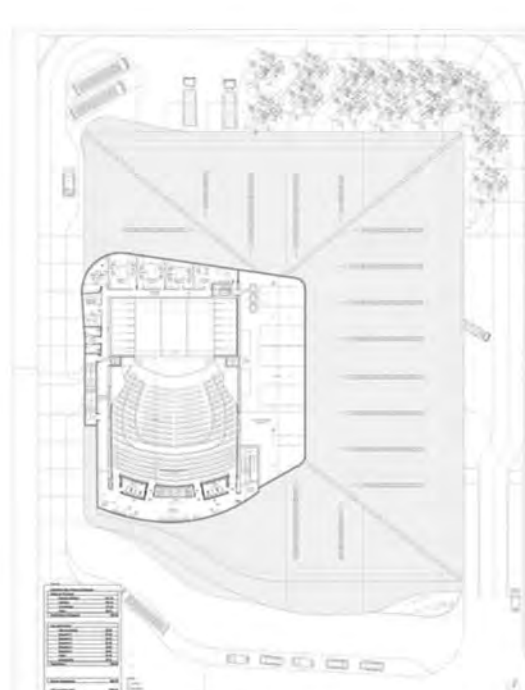
SEGUNDA PLANTA/ SECOND FLOOR PLAN