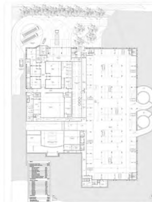
SÓTANO/ BASEMENT PLAN

WE BELIEVE THIS PROJECT MEETS A VIABLE ARCHITECTURE, NO SPECIAL EFFECTS OR SOPHISTICATED TECHNOLOGIES TO CONSTRUCT A BUILDING COMMITMENT TO ORIGINAL AND INNOVATIVE, BOTH TYPOLOGICAL AND FORMALLY. WE AVOID AMBIGUITIES THAT BECOME ARCHITECTURES THAT ARE FORMALIZED WITH OTHER CONFERENCE CENTERS, OTHER ARCHITECTURES. THIS PROPOSAL IS CONCEIVED AS ONE PROJECT ONLY TO THIS PLACE, AND THIS PROGRAM. AS ARCHITECTURE AND UNIQUE.