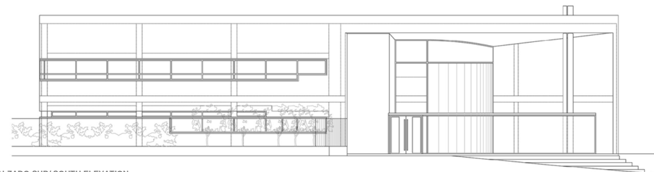
ALZADO SUR/ SOUTH ELEVATION