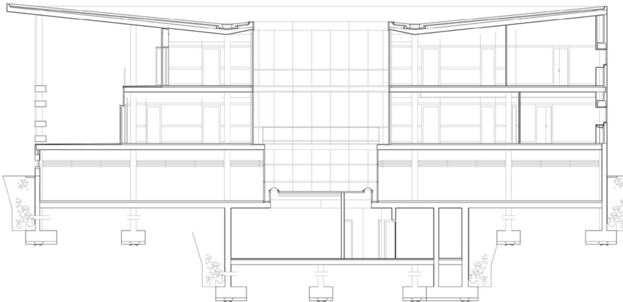
SECCION LONGITUDINAL/ LONGITUDINAL SECTION

THE PROJECT ORGANIZATION IS EXTREMELY EASY. ITS FLEXIBILITY HAS BEEN A PRIORITY OBJECTIVE IN THE DESIGN, WHICH HAS TRIED TO GET AN SPACE FREE OF SERVER STRUCTURAL SPACES, AND CONNECT THE SERVER ELEMENTS IN A MAIN SYSTEM WHICH NEVER IMPEDE THE CENTRE ORGANIZATION.