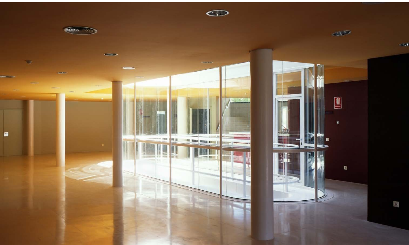
MEDICAL CENTRE/ PARQUE COIMBRA

LA ORGANIZACIÓN DEL PROGRAMA ES MUY SENCILLA. EL EDIFICIO SE ESTRUCTURA EN CUATRO NIVELES ADAPTÁNDOSE A LA TOPOGRAFÍA DEL TERRENO. EL ACCESO PEATONAL SE PRODUCE POR EL NIVEL INTERMEDIO (PLANTA BAJA) Y EL DE COCHES POR EL INMEDIATAMENTE INFERIOR (SOTANO PRIMERO)